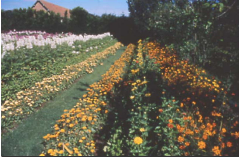
Le potager « Arc-en-ciel » – Robert de Bosmelet ©