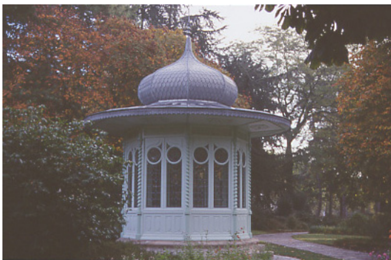
Parc de Procé, kiosque - Service des Espaces verts de Nantes ©

Un site Internet ( www.jardins.nantes.fr ), présentant tous ces parcs, a été mis en place depuis le mois de janvier. Il est visité par 10 000 entrées par mois, démontrant tout l'intérêt du public pour ce patrimoine.