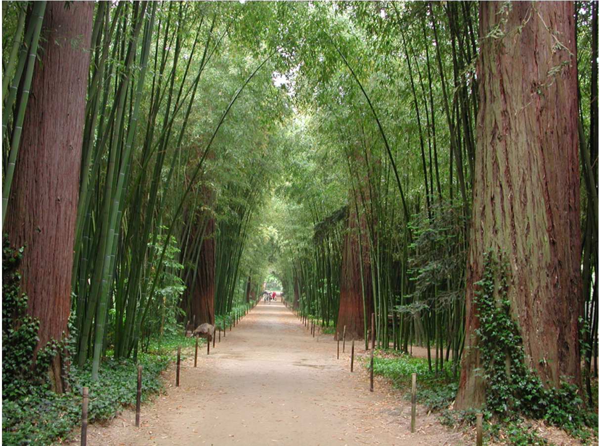
Bamboueraie Prafrance, allée d'entrée – Madame Crouzet ©

Pour durer, un jardin doit s'avoir s'adapter. Il faut sans arrêt trouver de nouvelles idées à développer. Par exemple, 2002 a été l'année du Laos, la Bamboueraie a célébré son nouvel an et mis en valeur ses richesses.