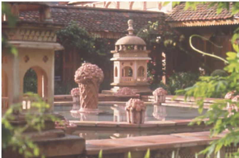
Les jardins secrets, le jardin délice – Paul Lutz ®